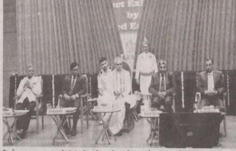
નિર્ભર ન હતા. ગ્રામજનોની ઉદ્યમિતાને કારણે જે ઉત્પાદનો થતાં તે દેશ-વિદેશમાં વેચાતા અને બદલામાં વેપારીઓ અઢથક સોનું મેળવતા. ભારતની ઉદ્યમિતાનું આ જલંત ઉદાહરણ છે. આપણું ભારત હંમેશાથી જ સમૃદ્ધ, ઉન્નત અને મહાન રહ્યું છે. પરિશ્રમથી જ પ્રગતિ થાય છે. કૌશલ્યપૂર્વક કરેલા કર્મોથી જ વિકાસ સંભવ છે. પ્રધાનમંત્રી નરેન્દ્રભાઈ મોદીએ ઉદ્યમિતાના વિકાસ માટે સ્ટાર્ટઅપ, મેક ઇન ઈન્ડિયા અને ઈનોવેશન ક્ષેત્રે અનેક નવી પહેલ કરી યુવાનોની પ્રતિભાનો વિકાસ થાય એવા અવસર આપ્યા છે. સામાન્ય પુરૂષો અન્ય કોઈએ નિર્મિત કરેલા

ઉજવણી, રુબીજયંતી સમારોહનો મંગલદાયક પ્રગટાવીને શુભારંભ કરાવતાં રાજ્યપાલ આચાર્ય દેવવ્રતએ કહ્યું હતું કે, ગુજરાતની આ ગૌરવવંતી સંસ્થા આ ક્ષેત્રમાં નવી ઊર્જાનો સંચાર કરનારી છે. તેમણે કહ્યું કે, આઝાદી પછી અનેક વર્ષો સુધી યુવાનોને માત્ર ડિગ્રી મળે એવું શિક્ષણ મળ્યું, પણ જીવન ઉપયોગી માર્ગદર્શન ન આપી શકાયું. પરિણામ એ આવ્યું કે, ડિગ્રીધારી યુવાનો વધ્યા પણ કૌશલ્ય નિર્માણ ન થયું. પ્રધાનમંત્રી નરેન્દ્રભાઈ મોદીએ આ પ્રથા પ્રત્યે ગંભીરતાથી વિચારીને તેને જાકારો આપ્યો અને જીવન પદ્ધતિ સુપ્રમથ બને એ હેતુથી કૌશલ્ય નિર્માણ જેવા ઉપાયો આપ્યા. આચાર્ય દેવવ્રત એ કહ્યું કે, ભારતના અતિતમાં જઈએ તો જણાય છે કે, આ દેશ 'સોને ક્રી ચીડિયા' તરીકે ઓળખાતો. ભારતની ઉદ્યમિતાને કારણે આવી ઓળખ ઊભી થઈ હતી. ગ્રામીણ નાગરિકો પોતાના કૌશલ્યથી પોતાપોતાનો વ્યવસાય કરતા. ગ્રામજનો અને ગામડાઓ શહેરો પર